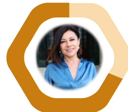
PAOLA DE MICHELI