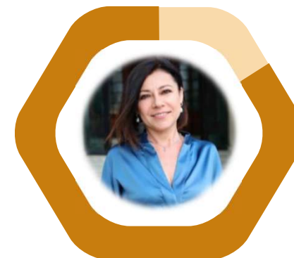
PAOLA DE MICHELI